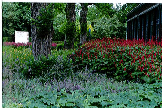
Bomen en schaduw