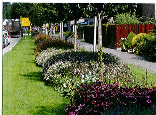
Ook bloei is mogelijk