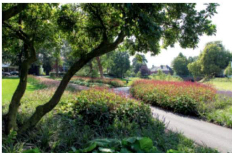
Op twee plekken in het park is het Green to Colour-concept van kwekerij Griffioen toegepast. Op de foto markeren de vaste planten een kruispunt van verschillende fiets- en wandelpaden. Er groeit onder meer Persicaria amplexicaulis , P. affinis 'Superba', Nepeta faassenii 'Grol' en Carex morrowii 'Variegata'.