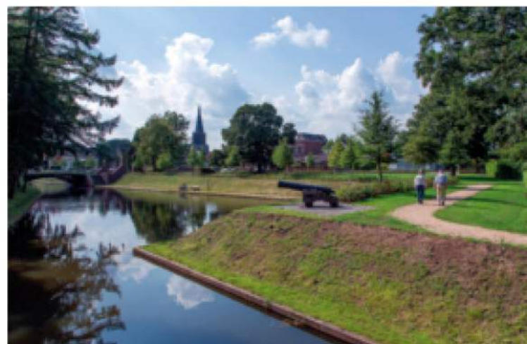
Bovenop de steile vestingwallen zijn rijen bomen en blokhagen aangeplant, beide bestaan uit Fagus sylvatica . Samen vormen ze nu als het ware de borstwering van de vesting.