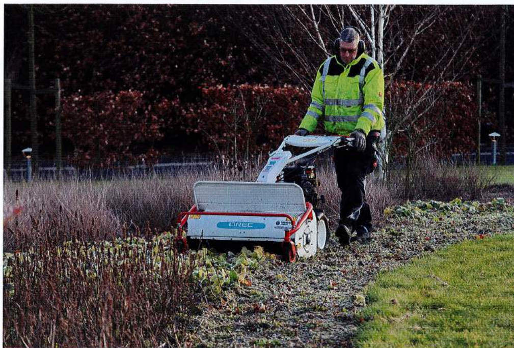
Maaien, mulchen, mesten in maart.

'Gewoon meedenken met de natuur; dat is eigenlijk alles'