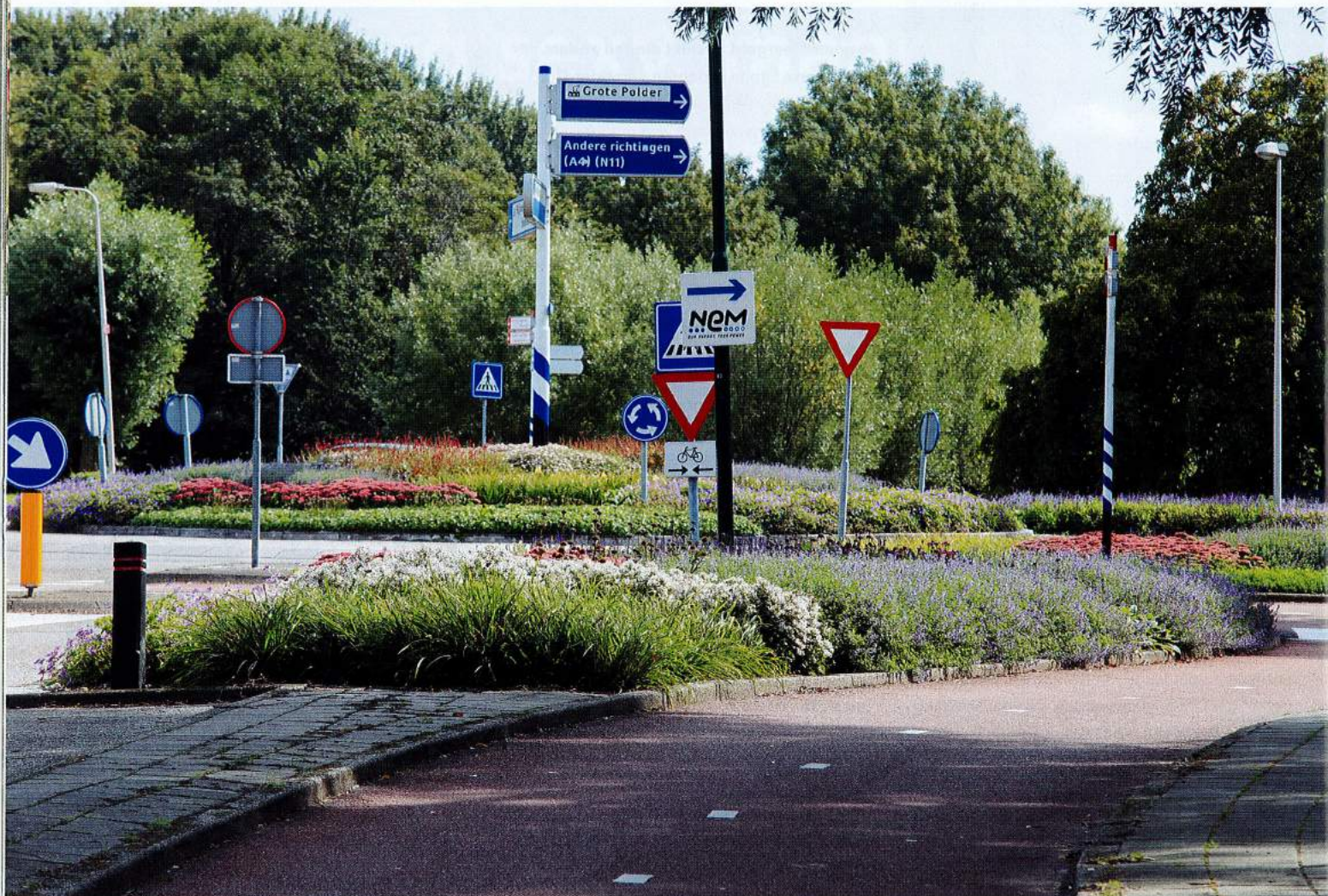
GreentoColour zichtbare lijn

'Ik geloof in die maat, hoewel we het ons er niet altijd makkelijk mee maken. Een opdrachtgever moet niet zelden prijzen vergelijken en voor de – op het eerste gezicht – goedkoopste oplossing gaan. In alle eerlijkheid: dan is 11 centimeter de verliezer. Alleen: als je even verder kijkt, zie je dat een 11 centimeter-pot met acht stuks op de m 2 een vergelijkbaar resultaat geeft als twaalf in de maat pot 9. Als opdrachtgever betaal je bij pot 9 dan 50% meer aan plantkosten. Ook watergeven is vrijwel nooit nodig bij de grotere buffer in de potkluit bij pot 11, terwijl het bij een kleinere potmaat een standaardpost is. Als je dat soort zaken bij elkaar optelt en even doordenkt, blijkt een grote maat voordeliger dan een kleine.'