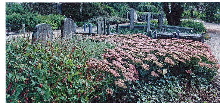
Begraafplaats Maria Rust in Rockanje

Wat heeft Griffioen gedaan. Zij hebben al die soorten en variëteiten aan vaste planten onderworpen aan een strenge